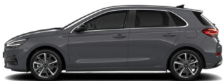
Ecotronic Grey Pearl