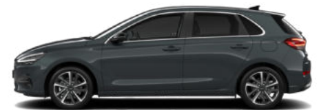
Cypress Green Pearl