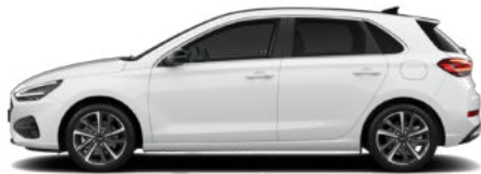
Serenity White Pearl