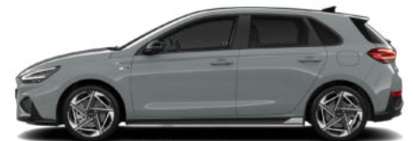
Shadow Grey nur für N Line