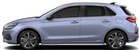
Meta Blue Pearl