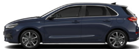
Sailing Blue Pearl