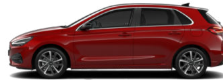
Ultimate Red Metallic