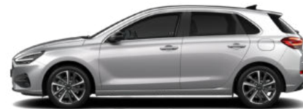
Shimmering Silver Metallic