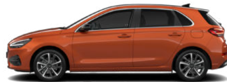
Jupiter Orange Metallic